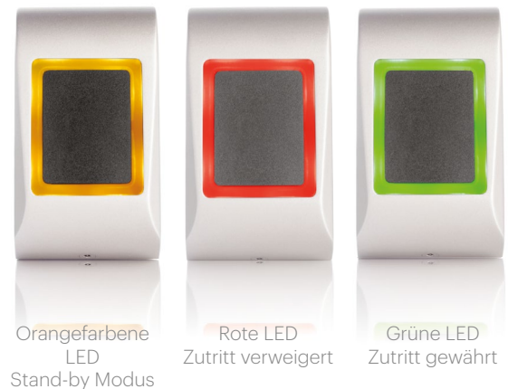
Orangefarbene LED Stand-by Modus